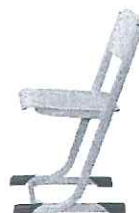
Bedřich židle pevná židle pevná