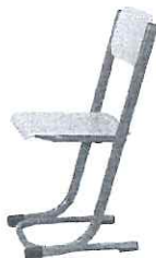
HUBERT židle stavitelná stavitelná žakovská židle