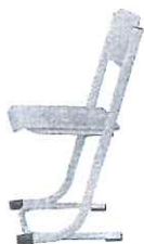
VOJTĚCH židle pevná pevná žakovská židle