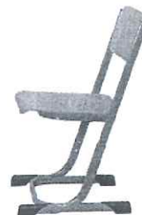
EDUARD židle studentská židle stavitelná